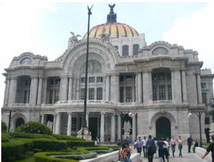
Ciudad de México

Y TAMBIEN CONSULTÉNOS PARA SERVICIOS EN PUERTO VALLARTA, IXTAPA, TIJUANA, MONTERREY, GUADALAJARA, MAZATLAN, VERACRUZ, XALAPA....ETC