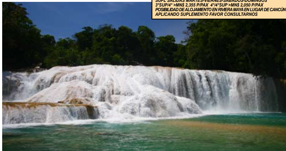
Cascada de Agua Azul

Salida hacia el Cañon del sumidero. Paseo en barco. Traslado al aeropuerto de Tuxtla Gutierrez. Fin de nuestros servicios.